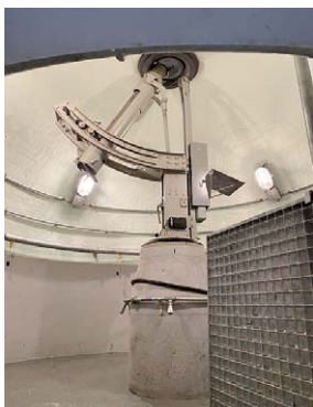
Am Ofenpass: Eine feuerspeiende «Burgruine» und ein Festungsminenwerfer von 1968.

Die beiden Sperrstellen von Ova Spin und Lavin sind noch bewaffnete Sperren von nationaler Bedeutung. 2021 werden sie erstmals für das Publikum geöffnet. Sie zeigen Kampfbauten des ersten Weltkrieges, des zweiten Weltkrieges und einen Minenwerfer aus der Zeit des Kalten Krieges.